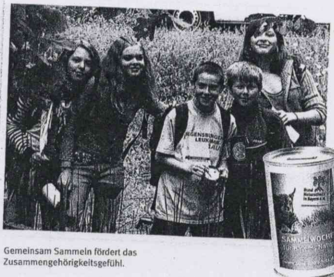
Gemeinsam Sammeln fördert das Zusammengehörigkeitsgefühl.

Das alles ist nur möglich weil so viele Menschen den BN mit ihrer Mitgliedschaft, Spende oder aktiven Mitarbeit unterstützen .